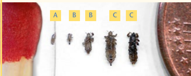
Для сравнения: спичка / 1-центровая монета

... проходит различные стадии от яйца через стадию личинки до взрослой, половозрелой особи. Яйца, хитиновые оболочки которых также называют гнидами (А), откладываются самкой у кожи головы и приклеиваются к волосам водостойким веществом. Через 8–10 дней после кладки из яиц вылупляются личинки (В). За 9–11 дней они превращаются во взрослые половозрелые особи (С) – и цикл начинается заново.